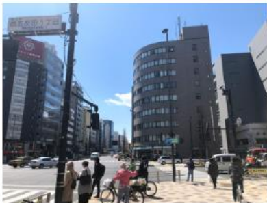
TSUTAYA、ブックオフを越えますと、西五反田1丁目の交差点があります。