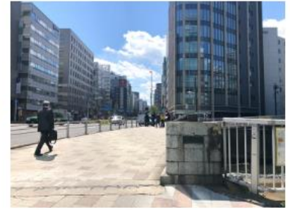
三菱UFJ銀行を越え、橋を渡り