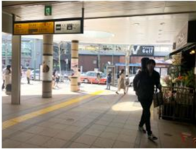
五反田駅西口を出て、駅を背にして右側へ。