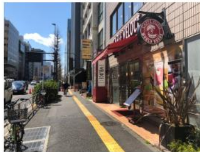
交差点にファミリーマート、ペローチェ、タリーズコーヒーの隣のビルです。