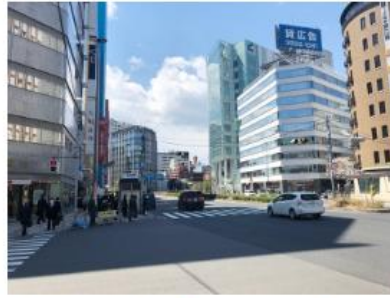
大きな通り（桜田通り）にぶつかるので、横断歩道を渡り左折。