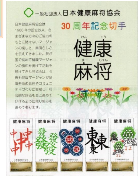
佳作 高山 均 (神奈川県)