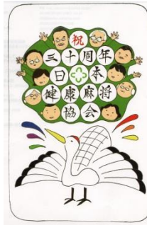
佳作 かりん灯 (東京都)