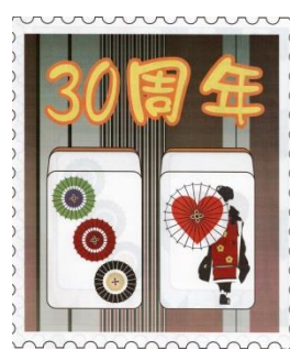
佳作 地蔵ランナー (東京都)

の制作を誠に残念ながら断念した。発表は佳作10点のみとして、本週末日までに佳作賞をお贈りします。