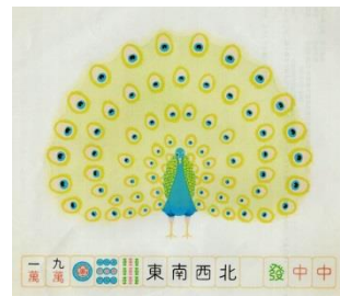
佳作 まさおみ(千葉県)