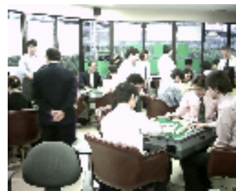
対局マナー研修の様子

高齢者を対象とした麻将教室や健康麻将サークル等の運営に必要な基礎知識を学び、講師助手や運営の補佐をするスタッフとしての資格です。